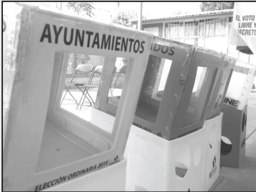
Candidatos Cumpliendo como ciudadanos